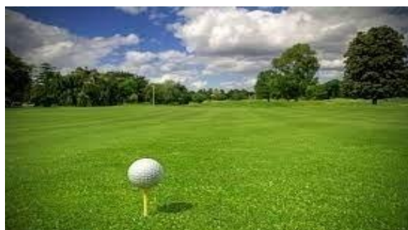
Terrains de golf